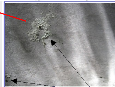
Zona de Corrosión media.

Las anomalías categoría 3 requieren de intervención inmediata ya que representan una amenaza para la operación de la línea.